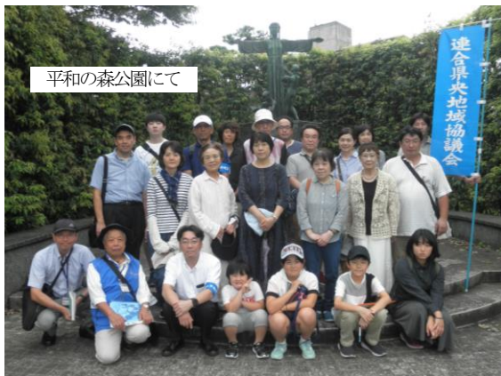
平和の森公園にて