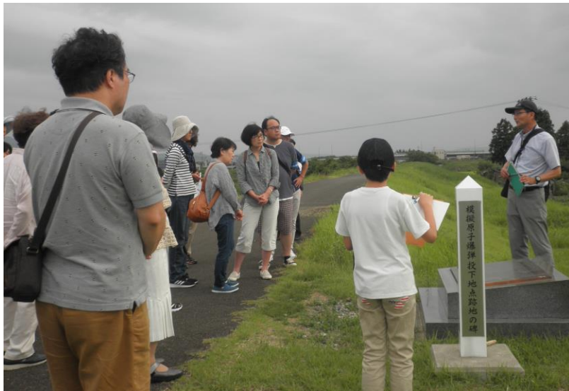
模擬原爆投下地で、ガイドさんの話に聞き入る参加者

この長岡空襲をはじめとした様々な惨事を次代を担う子や孫に語り継ぐことが大切と再認識する