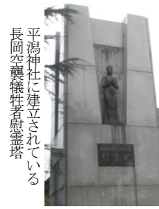
平潟神社に見学したときは、この広い境内に多くの人が避難され、亡くなったかと思うと、自分の身に起きたことのように苦しく感じました。ボランティアガイドさんが、「こんな悲惨なことがあったことを伝えてください。」と言われていましたが、戦争が起こると悲惨な思いをするのは普通の生活をしている人たちだということがよくわかりました。長岡空襲を知り、平和の尊さを学ぼうというフィールドワークに参加し、学んだことをほかの人たちにも伝えていかないといけないと思いました。(参加者K.Rさんより寄稿)

長岡戦災資料館で、空襲のことをまとめたビデオを見て、戦時中ではありましたが、日常生活の中で突然、焼夷弾が雨のように落とされ、町が炎で焼き尽くされたことを知り、自分であったら、どうしていただろうと考えさせられました。防空壕へ避難した人たちも亡くなった方も大勢いられたということで、大変驚きました。