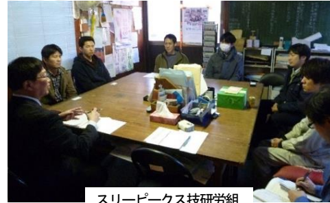
スリーピークス技研労組

指定日、有給休暇の取得率、初任給、60歳以降の方の処遇などについて確認し意見交換。事務局からも人手不足感についてお聞きし、「人手不足はあるが嘱託者も含めた今の規模でやっていく」「募集したギリギリの人数しか応募がない」といった状況を聞くことができ、ほとどの職場でも多かれ少なかれ人手不足であるとあらためて認識したところ