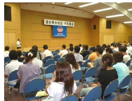
＜今村昌平監督「黒い雨」上映会＞

参加した方から「以前にも見た。日本中、世界中の人に見てほしい映画」「平和の尊さを伝え続けて行く必要がある。こうした集会を続けていくことが大切」との感想を頂きました。上映終了後、会場で平和福祉募金を行い、16,000円が集まりました。平和の運動に役立て貰うため、広島と長崎の平和祈念資料館へ送らせていただきました。