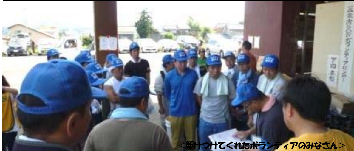
＜駆けつけてくれたボランティアのみなさん＞

7月29日(金)から30日(土)にかけて新潟県の中越・下越地方や福島県会津地方を中心に、7年前の7.13水害を超える記録的な雨量により、新潟県内では死者4名、浸水家屋8,529棟(床上、床下浸水)農地被害・土砂崩れなど甚大な被害が発生しました。県央地協では連合新潟と連携し、ボランティア体制を立ち上げ、8月6日(土)～12日(金)の7日間で73名の構成組織のみなさんから協力いただきました。(遠く上越地協や柏崎地協の構成組織のみなさんも参加しました)