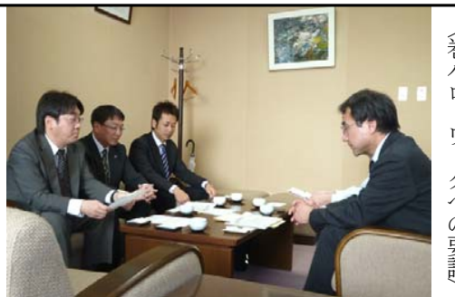
巻ハローワークへの要請

労働相談事例を報告し、契約時の「雇用契約書」「労働条件通知書」などの明示の徹底、雇用保険の未加入防止、離職時や失業給付の際の丁寧な説明などを要請しました。