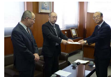
<労働基準監督署への要請>