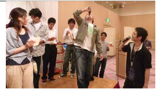
<コーラを一気に飲み干して!>

9月26日(日)午前8時から、燕三条地場産センター周辺地域において、青年女性委員や各単組から参加を募り、27名が参加し、「全国統一行動列島グリーンキャンペーン」を開催しました。当日は朝から晴れ渡り絶好のイベント日和となりましたが、「ゴミが捨ててあるのが当たり前のように感じていた」「今回の参加で、ゴミ問題や環境保護についても認識を深めた」などの声もあり、捨てる側の意識を変えていく取組みも必要だと感じました。