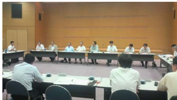
＜燕三条地域景況対策会議＞