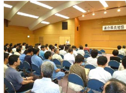
＜大勢の皆さんと映画鑑賞＞

上映終了後、会場で平和福祉募金をおこない、12,000円が集まりました。平和の運動に役立て貰うため、広島と長崎の平和祈念資料館へ送らせていただきました。