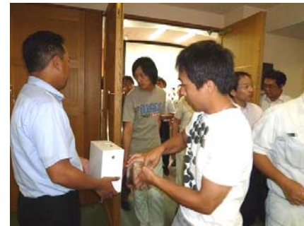
＜平和募金に協力を＞