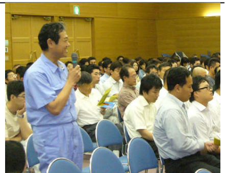
＜参加者からの質問「地域の雇用など自助努力だけでは限界がある。打開策のアドバイスは？」＞