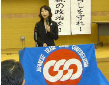
＜政策や政権交代の意気込みを語る菊田衆議院議員＞

7月13日(月)三条燕地域リサーチコアにて18:30より、菊田衆議院議員を招き政策研修会を開催致しました。当日は仕事帰りの忙しい時間帯ではありましたが、約200名の参加がありました。最初に菊田衆議院議員は国政全般について報告を行い、続けて現在の景況に触れ、景気対策(税金の無駄遣い、大企業偏重の予算執行、地場産業の体力づくりの必要性)雇用・年金・医療・子育て支援などの社会保障政策の重要性などについて、具体的に説明した後、間近に迫った総選挙への意気込みを訴えました。その後、佐藤議長と参加者を交えての対談形式でいくつかの質疑を行いました。